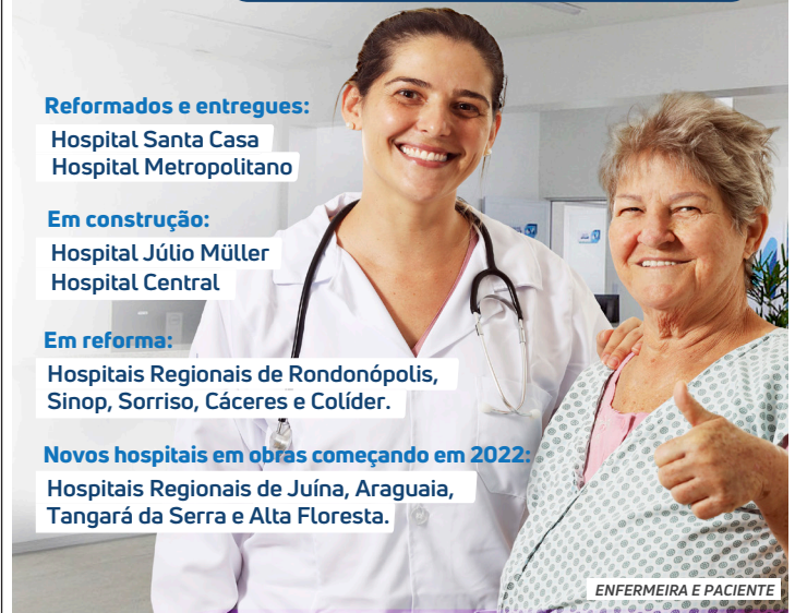
ENFERMEIRA E PACIENTE

Hospitais Regionais de Juína, Araguaia, Tangará da Serra e Alta Floresta.