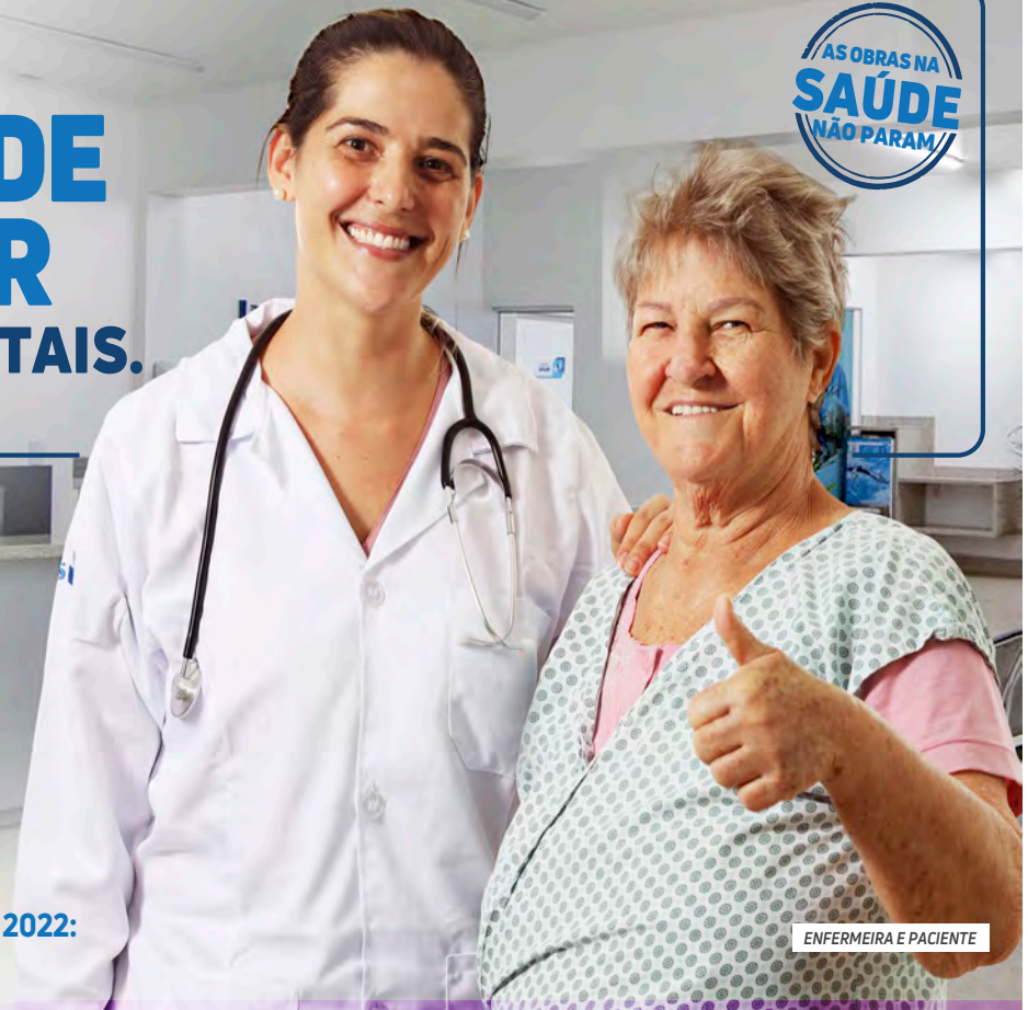
ENFERMEIRA E PACIENTE

É O GOVERNO DO ESTADO CUMPRINDO SUA OBRIGAÇÃO DE PRESTAR CONTAS DO QUE FAZ AO CIDADÃO.